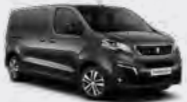
Siva Platinum (2)