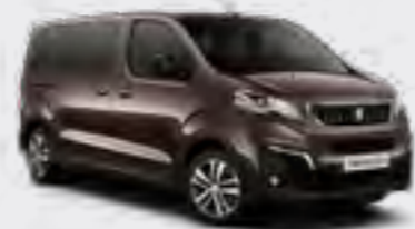
Braon Rick Oak (2)