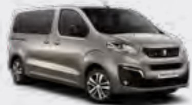
Silky Siva (2)(3)