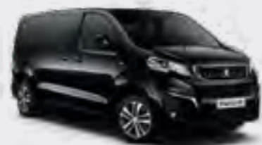
Crna Perla Nera (1)