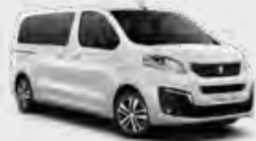
Bela Banquise (1)