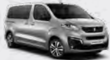
Siva Artense (2)