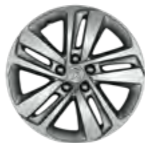
Felna Phoenix 17" sa dijamantskim efektom (1)

(1) U standardnoj opremi na Traveller i e-Traveller.