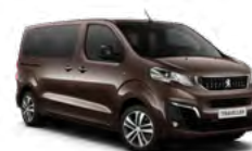
Braon Rich Oak