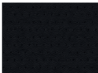
Unutrašnjost od Crne kože "Claudia"