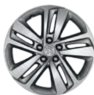
17" aluminijumske felne