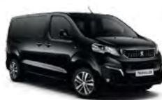
Crna Perla Nera